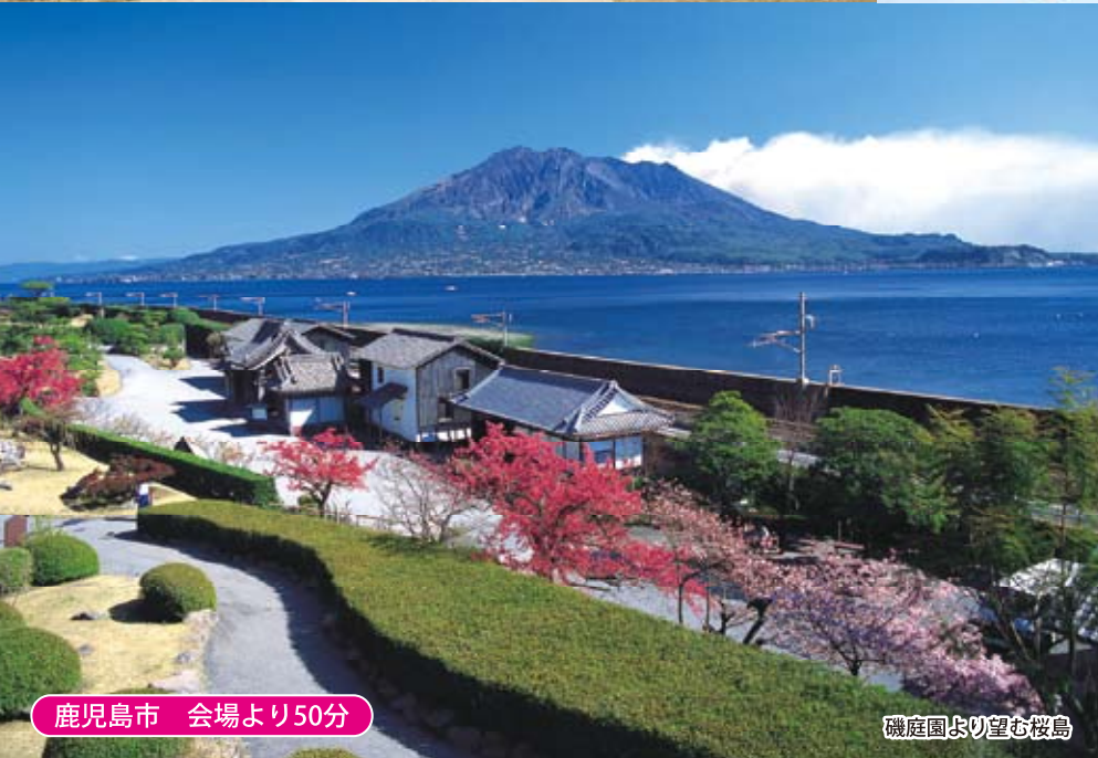
鹿児島市 会場より50分