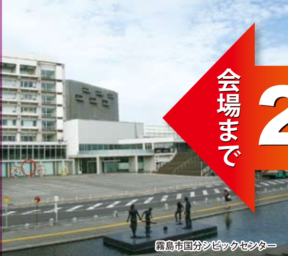
霧島市国分シビックセンター