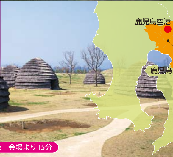
霧島市縄文の森 会場より15分